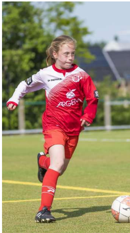
Ieme (°2012 - U16)